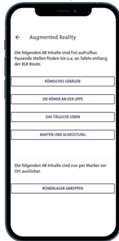
Abb. 2 Beispiel zur markerlosen Auslösung in der App zur Römer-Lippe-Route