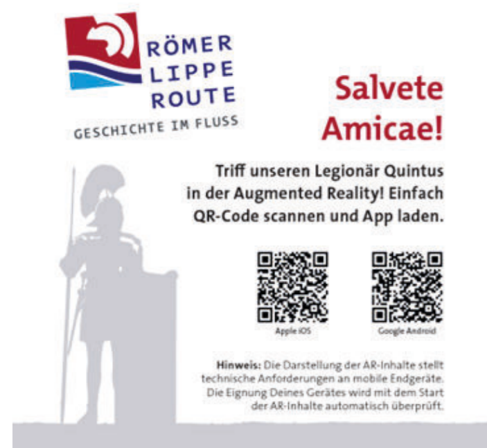
Abb. 5 „Info-Sticker“ und Screenshot aus der AR-Szene „Legionär Quintus“

Die AR-Inhalte zur RLR wurden in die bestehende App eingebunden und werden den Nutzenden ausgehend von dem Start-Bildschirm über eine eigene Auswahlfläche „AR-Inhalte“ angeboten. Direkt aus der App können die drei AR-Szenen „Römischer Legionär am Wegesrand“ bzw. die Szene „Römische Insula“ gestartet werden, sie sind ohne speziellen Marker abrufbar. Die AR-Szene „Römerlager Anreppen“ ist hier zwar hinterlegt, aber kann nicht aus der App heraus gestartet werden. Hierzu ist das Abscannen des Markers im Römerlager