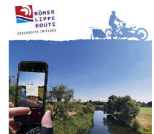
Digitalisierung im Radtourismus am Praxisbeispiel der Römer-Lippe-Route

Übersicht digitaler Dienste und Empfehlungen für Anwendungen im Radtourismus