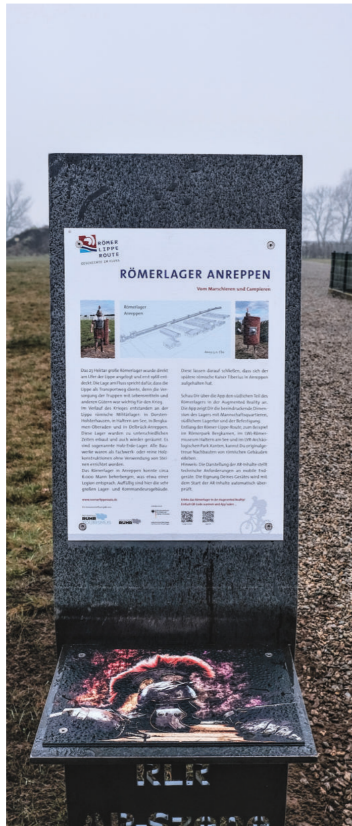
Abb. 3 Cortenstahl-Stele mit Infotafel und Markerbild im Römerlager Anreppen

zahlreichen geeigneten Stellen erlebbar und digital greifbar zu machen.