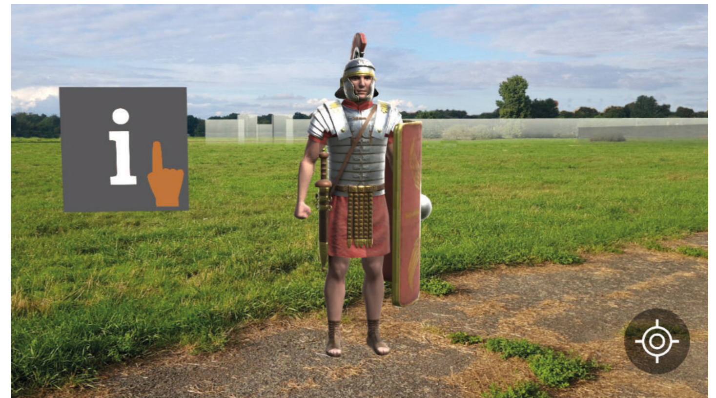
Abb. 4 Screenshot aus der AR-Szene „Römerlager Anreppen“/Markerbild

Die AR-Szene im Römerlager Anreppen wird markerbasiert, über eine im Lager platzierte Stele mit aufmontierter Infotafel und Markerbild, ausgelöst.