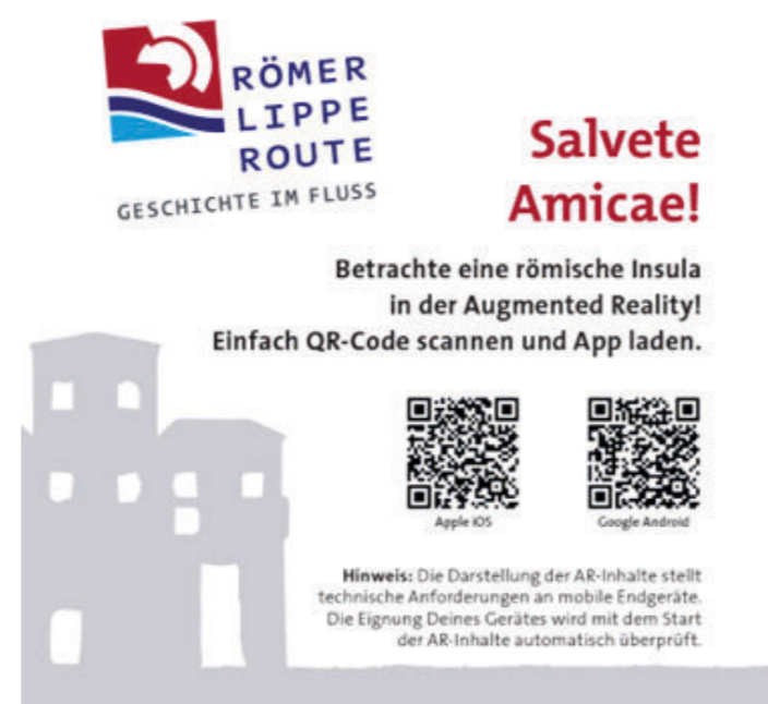
Abb. 6 „Info-Sticker“ und Screenshot aus der AR-Szene „Römische Insula“