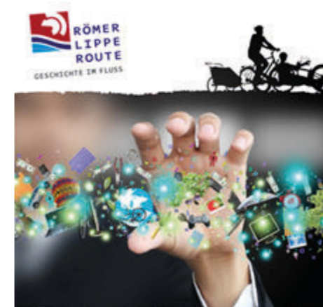
Digitalisierung im Radtourismus am Praxisbeispiel der Römer-Lippe-Route

Digitalisierung ist ein gesellschaftlicher Megatrend, entlang der Customer Journey werden digitale Dienste häufig genutzt. Vor diesem Hintergrund und getrieben von (potenziell) leistungsfähigen, digitalen Lösungsmöglichkeiten gewinnen Erlebnisstationen mit digitalen Elementen zunehmend an Bedeutung. Dahinter